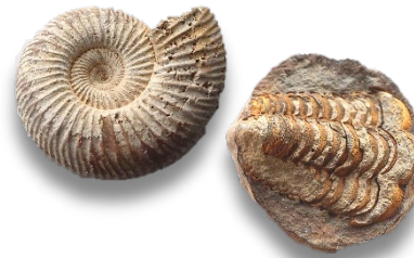
アンモナイト・三葉虫 Ammonite & trilobite

炭酸カルシウムでできた堆積岩。フズリナ、有孔虫などの化石を含むものがある。泥を多く含むものは黒っぽい。ジュラ紀の付加体である美濃帯中に石灰岩体として産する。岐阜県山県市を流れる神崎川の河床で採集。