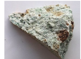
凝灰岩(ぎょうかいがん) tuff

アンモナイトは中生代に繁栄した軟体動物の仲間。化石はジュラ紀のペリスフィンクテスの仲間でマダガスカル産。三葉虫は古生代の節足動物。化石はオルドビス紀に繁栄したカリメネの仲間モロッコ産。