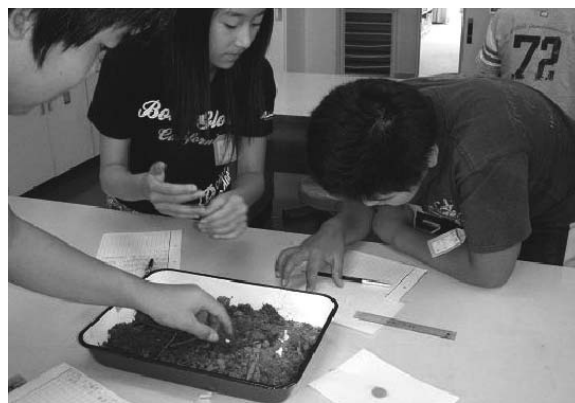
図4. 土砂堆積物の観察をする児童。

一人一人の児童は、様々な見方や考え方で個人追究を行った。しかし、全体交流よって、「田の下が層になっている」と予測し、「粒の大きさ」を視点に観察をすれば判断ができるという見通しをもった。また、層になる理由は「堆積の順序性」を調べれば根拠となるのではないかという考え方が全員に広まった。