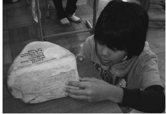
図6. 水縞粘土の標本を観察する児童.

メスシリンダーで行った実験装置と実際の田の状態とを比較し、結果が異なった要因を推論し、次の実験の必要性を見出した。さらにこの後、斜面を用いたモデル実験も行い、体得したことから田の観察結果を次のように結論付けた。