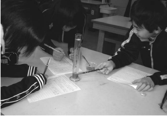
図5. 地層実験の様子.