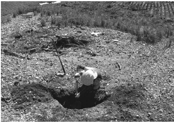
図3. 7月15日の大雨でできた土砂堆積物の教材化の作業の様子。

をもちやすいと捉えたためである。上之郷小学校の西側にある水田に積もった堆積物を用いて、地層の成り立ちを調べる基礎となる見方や考え方を見いだすことができるようなVTRを作成した。田に積もった土砂を発掘して地層の重なりがわかる地層断面を観察できるようにした(図3)。VTRは、①田に積もった堆積物全体の様子、②積もった部分を掘った断面の様子の2本を収録して、授業に使用した。また、実際の堆積物を観察することが出来るよう、特徴ある層ごとにサンプルを採取し、観察に用いることができるようにした。