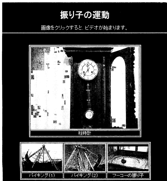
図1. web教材『振り子の運動』。 (理科教材データベース)

現職教員12年目研修コース「EZT061401:2学期から使える理科教材開発・指導案（小学校）」は、2学期に小学校理科教育において研究授業を計画している教員、あるいは2学期に学習する単元において有効な教材の開発や指導法の工夫を目指す教員の方々を対象としたコースである。第1日目の研修では、取り組む単元について研修教員と協議し、従来の実践事例の研究、研修期間中に行う教材研究の内容、単元指導計画の構想について検討を行う。第2日目から4日目の研修は、研修教員が勤務先の小学校で教材研究を行う。第5日目の研修は、教材研究の結果を検討し、