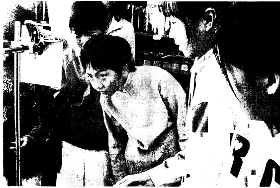
図3. 振り子の実験を行う子供達の様子。