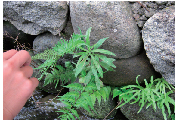
図6. 席田用水見学で生徒が撮影した画像の例。上：富有柿畑、下：シダ植物。