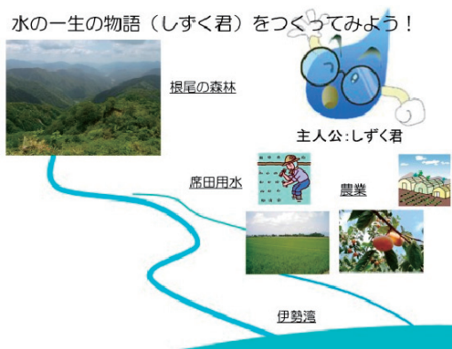
図3. 生徒に提示した「しずく君の物語」に関する課題.