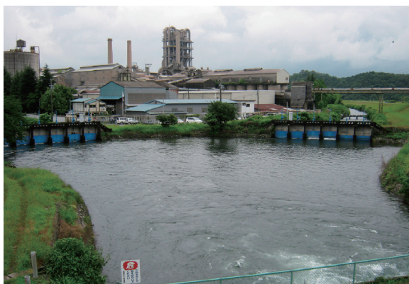
図1. 本巢市山口の席田用水頭首口のようす。手前が根尾川の堤防。左側が席田用水の頭首口、右が真桑用水の頭首口。席田用水の頭首口に史跡がある。

そこで、こうした歴史的出来事に関する史跡が残されている本巢市山口の席田用水取水口の現地見学を行うというアイデアがだされた。