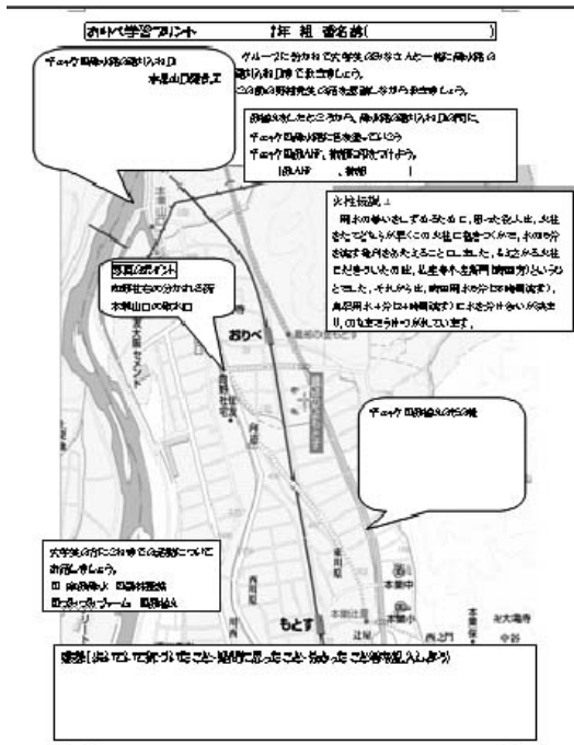
図5. 席田用水見学で使用したワークシート。

見学に行った。グループ毎に分かれ、TAとして参加の大学生とともにデジタルカメラを持ち、様々な自然に触れながら、実際に確かめていった。また、図4に示すワークシートに気づいたこと、考えたこと、感想などを記入していった。