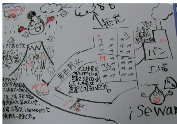
図4. 生徒が描いたしずく君の物語の例.