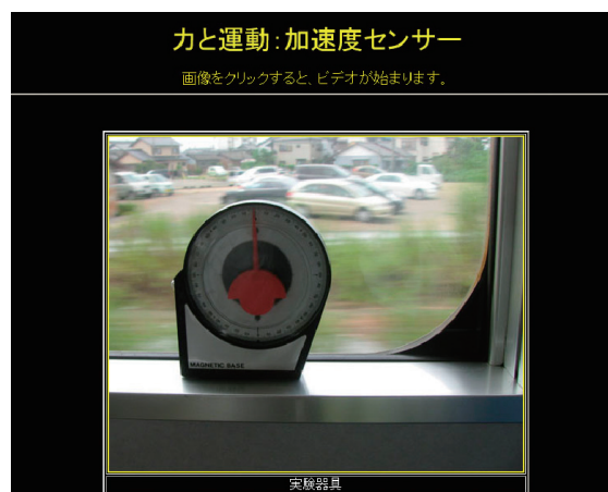
図2. 電車の走行時におけるアングルフインダーによる実験。webサイト教材「理科教材データベース」の表示画面の一部。

水平方向の力については、JR東海道線と東海道新幹線の電車の中、および国内線旅客機内で実験を行った(図2)。