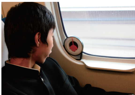
図3. 新幹線のなかで実験をする生徒。