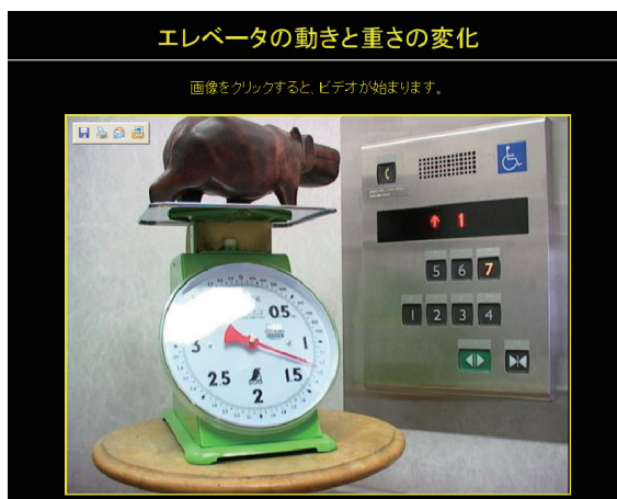
図1. 上皿ばかりによる加速度の可視化に関する実験。webサイト教材「理科教材データベース」の表示画面の一部。

水平方向の加速度を測定する装置としては、角度測定器を用いた。これは物理振り子になっていて、加速度を感じると、慣性力によって重心のまわりで重りが振動し、その動きを角度で表示するものである。角度測定器は、「アングルフインダー」という安価に市販されている商品を用いた。これらの器具は、加速度を定量的に測定するものではないが、中学校段階での見方や考え方を育む手だてとしては有効ではないかと考えた。