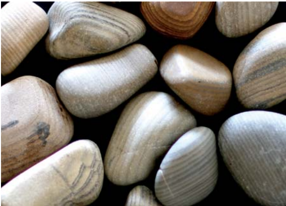
図5. ロシアシロ海海岸で採集した氷縞粘土岩. 約23億年前の氷河時代の堆積物. 白っぽい層と黒っぽい層が1セット. 1年に1セットずつ堆積したもので, 枚数を数えると堆積するのに要した時間の長さがわかる.