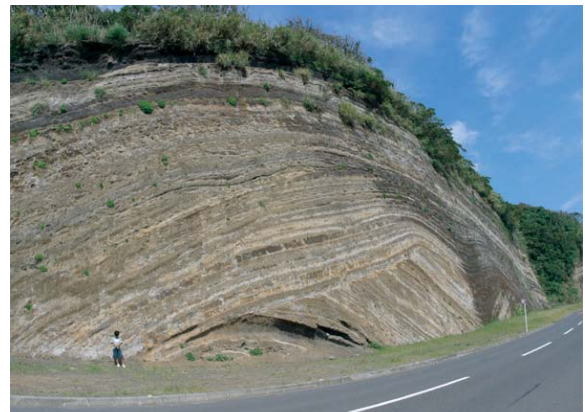
図7. 伊豆大島の地層大断面の露頭写真. 火山灰層とレス（風成塵）の互層. 約2万年前から現在までの間に約100回起こった爆発的噴火で形成されたもの.

予想を口頭で発表してもらったあと, 伊豆大島の地層については約1万年, グランドキャニオンの崖にみられる地層については, 約3億年という時間の流れのなかで形成されたことを話した.