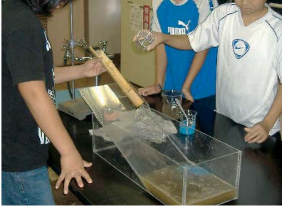
図1. 流水実験器で地層をつくる活動を行なう児童のようす。