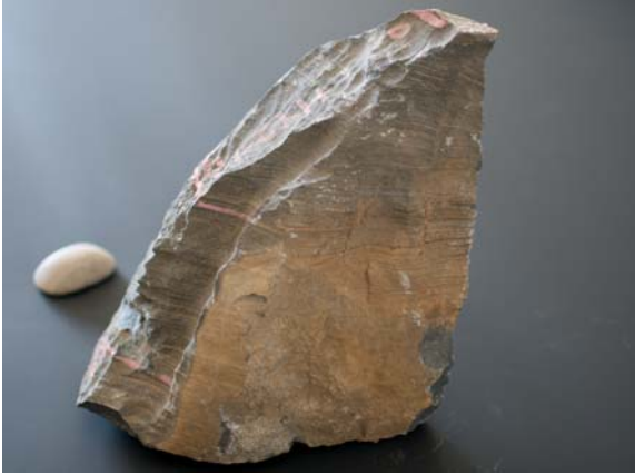
図4. ナミビア北部のラストフキャップカーボネート（約7億年前）の岩石標本. 細かい縞模様が発達している.