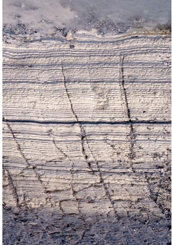
図6. 立山地獄谷の縞状硫黄堆積物の露頭写真.

ロシア白海の小石で, 地層の縞模様から地学的時間スケールに対するという見方をしたあと, 地層を写した画像を示して, それらの地層が堆積した時間の長さを予想するという課題を出した. 今回子どもたちに見せた地層は, 伊豆大島の地層大断面の露頭写真と, アメリカのグランドキャニオンの遠景写真である. 子どもたちの