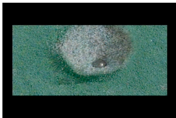
図3. カラーサンドに鉄球を落下したときにできる過渡的クレーター。

鉄球を砂に衝突させるクレーター実験は、月面の地質や地形を学習する目的で、授業に導入されている(高田ほか, 2000; 川上ほか, 2008)。カラーサンドを用いた成層構造をもつ標的では、クレーターの形成によって地表付近の砂が吹き飛び、形成されたクレーターの内壁では斜面崩壊が起こり、最終的なクレーターが形成される。クレーターの形成実験のようすを高速度カメラで撮影することで、砂の粒子がどのような運動をするかを視覚的に理解できるようになった(図3)。