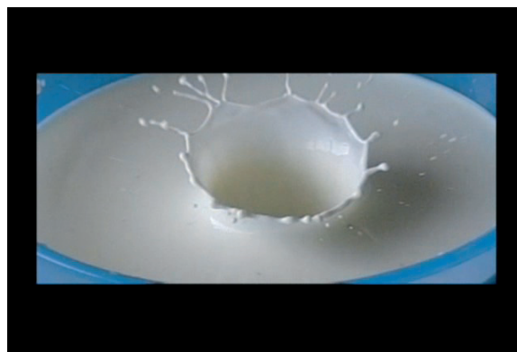
図4. ミルクを入れた容器にイチゴを落下させてつくったミルククラウン。

クレーター形成実験で、中央丘型クレーターがどうしてできるかをアナログ的に示すには、ミルククラウンの実験がわかりやすい。牛乳を入れた容器に、イチゴを落下させ、ミルククラウンができるようすを撮影した(図4)。