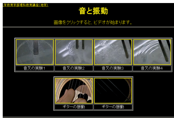
図2. 音叉の振動やギターの弦の振動を示したweb教材「理科教材データベース」の表示画面の一部。

デジタルコンテンツの開発では、弦の長さを統一したギターを用い、ピックではじいて弦の