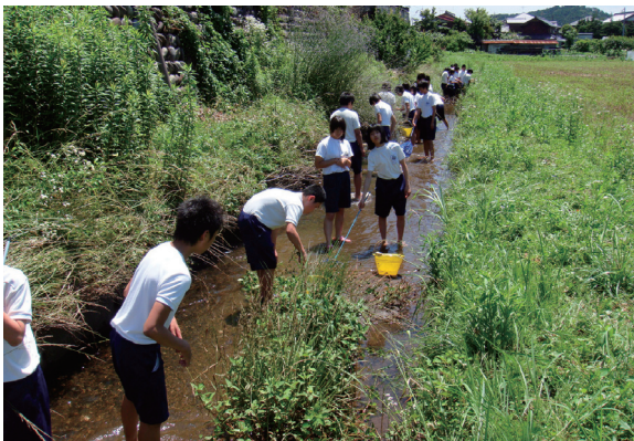
図1. カエルの捕獲活動の様子。

関市立武芸川中学校の校区内を流れる武儀川や用水路に出かけ、生息する生物を捕獲・採集した(図1)。トノサマガエルをはじめ、サワガニやザリガニ、トンボのヤゴなど、様々な生物を捕獲・採集することができた。終末で解剖することも踏まえて、比較的大きいトノサマガエルを確保した。その他の生物についても飼育したい生き物を持ち帰ることにした。