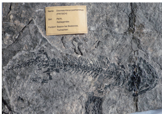
図6. 古生代ペルム紀の両生類、ディスコサウリクス化石。

ブタとカエル、イワシの内臓や骨格の比較から、セキツイ動物の体のつくりに関する共通性を見出すことができた。一方で生物進化という観点では、時間の流れに対する認識が必要であった。両生類、カエル、イカ・タコ、魚類などの化石を単元の学習の中で提示するなどして、第1学年「大地のつくりと変化」における学習内容との関連性をもたせることが今後の課題として残った。本授業の実践のあとであったが、古生代ペルム紀に生息していたディスコサウリクスを確保し、現生のカエルやイモリと骨格が比較できるようにした(図6)。さらに、古生代のシーラカンス化石なども確保した。カエルの捕獲、長期的な飼育、セキツイ動物の骨格の比較から進化へつながるような学習を展開していくことが今後の課題である。