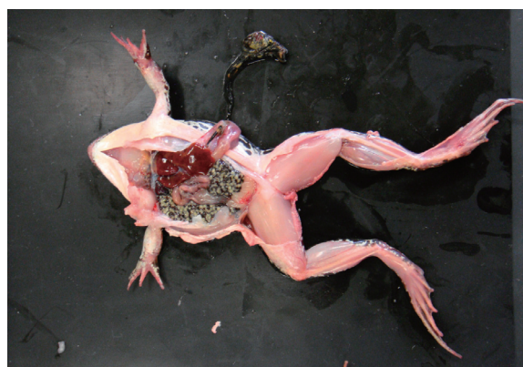
図3. トノサマガエルの解剖。

これによって、生徒は自分たちで相談しながらカエルを隅々まで解剖し、観察することができ、カエルを「気持ち悪い」と話していた女子生徒でさえも、熱心にカエルに向き合う姿が見られた。