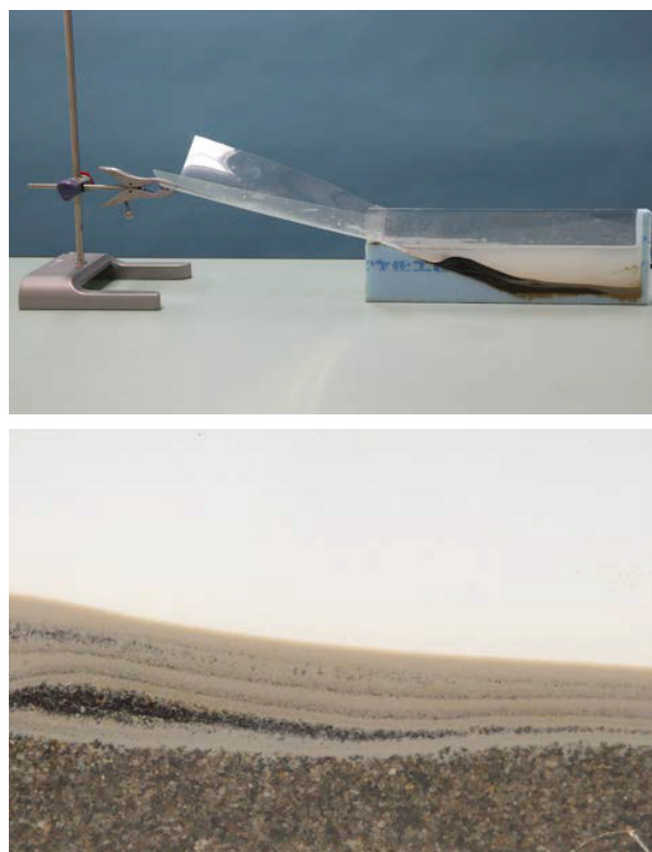
図 2. 水槽実験器と形成された地層の例。

土砂については、野外で級化した地層の重なりが観察できる岐阜県山岡町の土岐砂礫層の露頭において、比較的粒子サイズの細かい砂礫が堆積している場所から試料採集を行って、斜面に土砂を配置させたあと、水を流すたびに土砂が流れ、そのたびごとに級化した地層が堆積するようにした。この水槽実験器については、長良小学校の授業で活用し、級化した地層を作ることができることを実証している。今回の授業実践では、粒径や比重の違いによって異なる色の地層が重なることに注目させるため、次節で示す年縞実験器で用いたものと同じ鹿児島県志布志湾で採集した砂鉄や、桜島の火山灰、灰白色の岐阜県多治見市産の陶土を使用して、ピーカーで水を繰り返し流し、ほぼ水平に成層した地層のできる条件を調べた。結果的には、細粒の桜島の火山灰と、多治見市の陶土を使用すると、きれいに成層した地層が形成されることがわかった（図 2）。このようなきれいに成層した地層をつくるには、細粒の灰白色の層ができるまでの時間がかかるため、実験に十分な時間をとることが必要である。