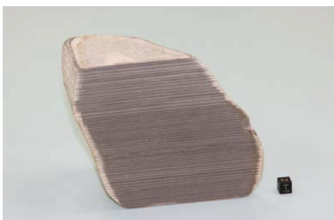
図 1. ロシア白海海岸で採集した年縞のある岩石標本。

約 50 個を地層学習用として日本に持ち帰っている。また、直径 20 cm ぐらいの大きさのものは、博物館での展示用として持ち帰り、京都大学総合博物館に展示していたが、この標本はその後 2 分割し、半分は京都大学総合博物館に展示し、残りの半分は授業用の標本として、岐阜聖徳学園大学で活用している（図 1）。これらの岩石の国外持ち出しについては、ロシア科学アカデミーのミーシャ・フェドンキン教授を通じて、輸出許可を得て持ち帰った。これらの岩石標本は、地層の枚数を年数に換算できる貴重なものである。