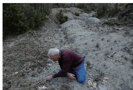
図4. フランスの Saint Paul-des-Fontes の露頭写真。

フランスのセント・ポール・デ・フォン (Saint Paul-de-Fontes) におけるアンモナイト化石の産状を示す写真を提示した (図4)。そして、アンモナイト化石を調べて、地層の時代を決める課題を提示し、図1に示したアンモナイト図鑑と化石標本をペアに1箱ずつ配った。化石の入った箱には2種類のアンモナイト化石があり、それぞれスケッチして名前をつける作業をし、名前についてはペアや班で相談するように指導した。