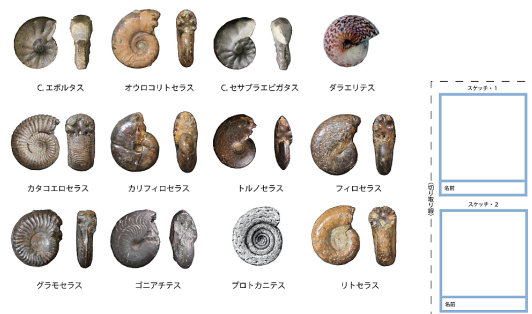
図1. アンモナイト図鑑。配布された2個の化石をスケッチし、名前をつける。