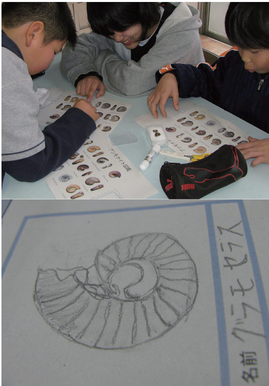
図5. アンモナイト化石を観察する子どもたちと描いたスケッチの例。

結果の交流では、ケースに含まれていた化石の名前を発表させ、同じ化石を確認した子は挙手させ、数を集計した。化石がカリフィロセラス、グラモセラス、リトセラスなどであることから、地層の時代が中生代のジュラ紀、白亜紀のものであると結論づけることができた。