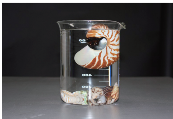
図6. オウムガイと巻貝の貝殻を水につける演示実験.